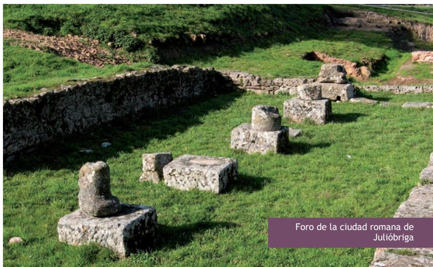
Foro de la ciudad romana de Juliobriga

A partir de este punto el GR se introduce en el parque que discurre paralelo al Ebro (orilla derecha) y, poco después de la calle del Marqués de Reinosa, cruzamos la avenida de Carlos III por el puente del mismo nombre, sin cambiar de orilla, hasta el final de la zona verde, junto a un paso a nivel.