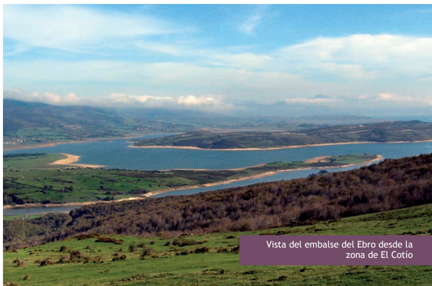
Vista del embalse del Ebro desde la zona de El Cotío

Las vistas son impresionantes: Peña Labra (2.017 m), Pico Tres Mares (2.222 m), Reinosa y el embalse y los meandros del Ebro. Al fondo surgen las montañas pasiegas, con el Castro Valnera (1.718 m) y el Picón del Fraile (1.648 m). Al Sur se extiende un inmenso espacio, hacia Valderredible y Castilla.