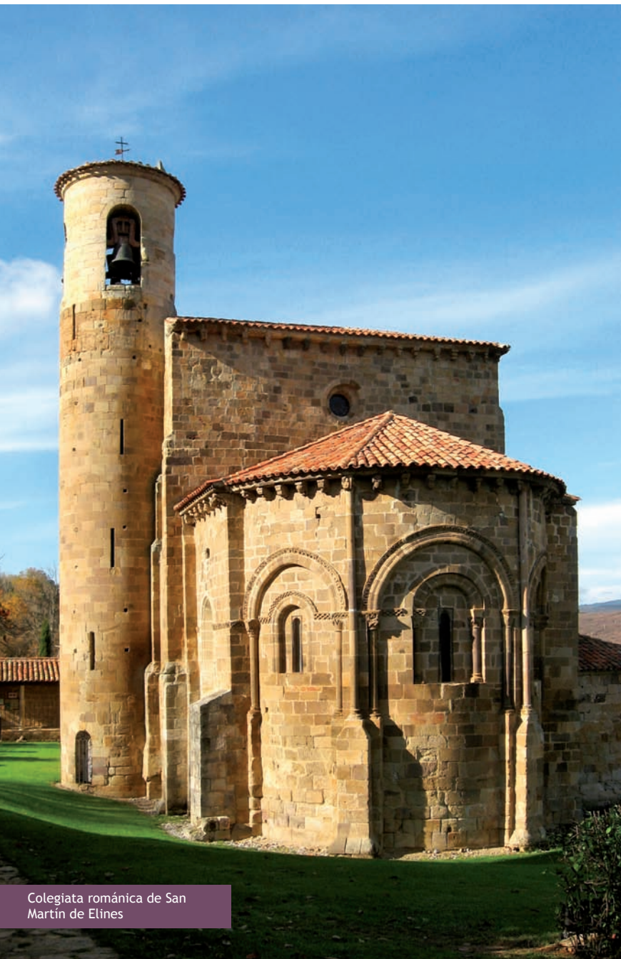
Colegiata románica de San Martín de Elines

En la plaza se puede visitar la colegiata de San Martín de Elines (preguntando al párroco o en la casa de enfrente), en origen monasterio benedictino con influencias mozárabes del siglo X. En el siglo XII se levantó su iglesia románica y en el siglo XVI el claustro, que alberga sarcófagos bellamente labrados del siglo XIII. El exterior muestra un carácter señorial: torre circular y un conjunto de maravillosos canecillos.