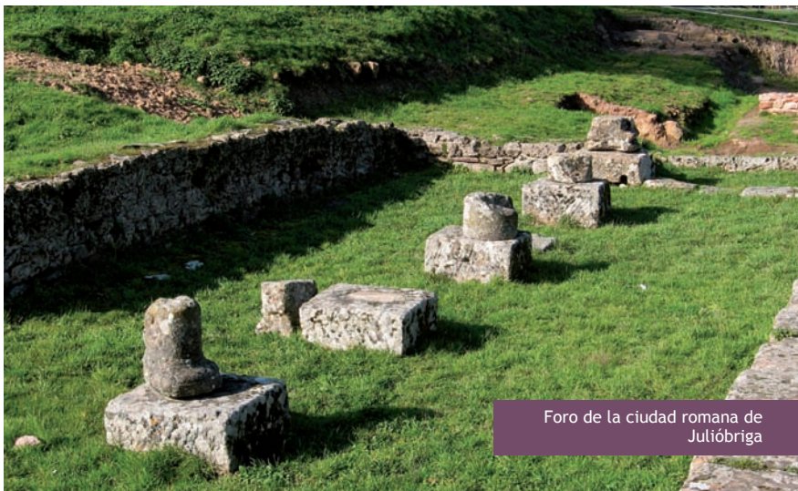
Foro de la ciudad romana de Juliobriga

A partir de este punto el GR se introduce en el parque que discurre paralelo al Ebro (orilla derecha) y, poco después de la calle del Marqués de Reinosa, cruzamos la avenida de Carlos III por el puente del mismo nombre, sin cambiar de orilla, hasta el final de la zona verde, junto a un paso a nivel.