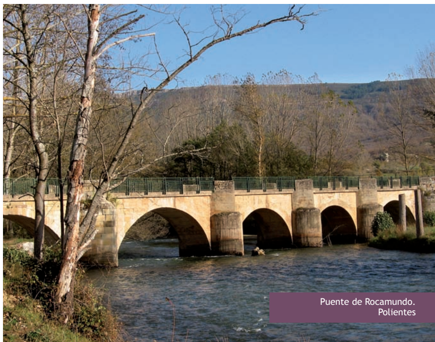
Puente de Rocamundo. Polientes

El recorrido da unos pasos por la carretera y prosigue por el camino viejo a Rebollar de Ebro, que arranca a la derecha entre quejigos. Llega a la carretera y penetra otra vez en un quejigal y una zona de campos. El sendero llega una explanada herbosa, con el Ebro a la izquierda y al fondo la ermita de Santa María. Un camino, a la derecha (ajeno al GR