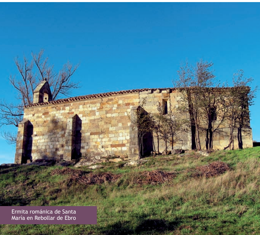
Ermita románica de Santa María en Rebollar de Ebro

La localidad ofrece buenos ejemplos de arquitectura civil, donde destacan su ayuntamiento (década de 1930), la oficina de turismo y el Museo Etnográfico de Valderredible (antiguo ayuntamiento que sufrió un incendio en 1931), donde conocer la historia, costumbres y tradiciones de la zona. Su Centro de Educación Ambiental desarrolla programas con escolares, dando a conocer el patrimonio natural y cultural de la zona.