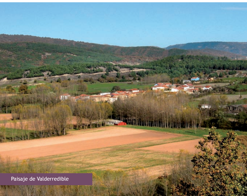
Paisaje de Valderredible

El camino atraviesa el arroyo Mardancho y toma una pista entre quejigos: el monte La Nía, con vistas a Cubillo de Ebro. Tras atravesar