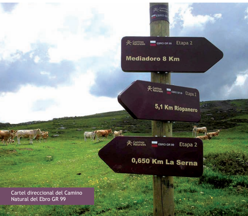
Cartel direccional del Camino Natural del Ebro GR 99

El recorrido se inicia en el monasterio de Montes Claros (970 m) y, por un carril asfaltado, baja al apeadero de Montes Claros. Tras cruzar las vías, hay dos opciones de ruta. Una baja al puente sobre el Ebro junto a Bustasur. Otra continúa por pista, entre pinos y hayas, hasta unirse en un desvío con la que viene del puente. La pista avanza 1 kilómetro entre hayas, pinos, robles y quejigos hasta la unión con la que viene del citado