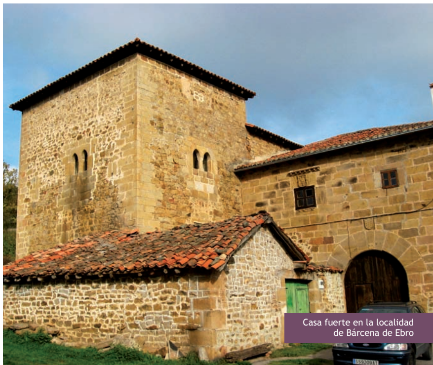
Casa fuerte en la localidad de Bárzana de Ebro

punte. Desde este punto, el camino avanza por pista a lo largo de un tramo fluvial cuya vegetación de alisedas y saucedas está catalogada en el Inventario Nacional de Hábitats. Tras bordear una loma y atravesar Valdeteje y El Hoyo, el camino pasa junto a un grupo de construcciones derruidas. Más adelante surge (en la margen izquierda) Baños de Aldea de Ebro, rodeado de enormes pinos.